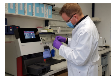
PrometheusNT.48 精确验证，品质卓越