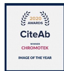
2020 年荣获 CiteAb 年度“最佳成像奖”